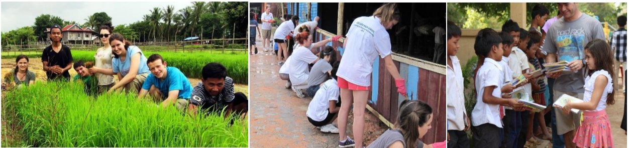
រូបភាពមួយចំនួនដែលទាក់ទងនឹងសកម្មភាពទេសចរណ៍ស្ម័គ្រចិត្ត

ទេសចរណ៍ស្ម័គ្រចិត្ត គឺជាប្រភេទទេសចរណ៍ដែលទេសចរស្ម័គ្រចិត្តចូលរួម និងផ្តល់ការគាំទ្រដល់គម្រោងអភិវឌ្ឍសំដៅលើកកម្ពស់សុខុមាលភាព ជីវភាពប្រជាជនមូលដ្ឋាន។ ឧទាហរណ៍ ទេសចរជួយច្រូតស្រូវសហគមន៍ ទេសចរជួយបង្រៀនភាសាដល់កុមារ។