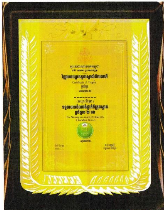
ទិញ្ញាបនបត្រទទួលបានស្នាដៃទី២ ដែលទទួលបានក្នុងឈ្មោះឆ្នាំ ២ ២០