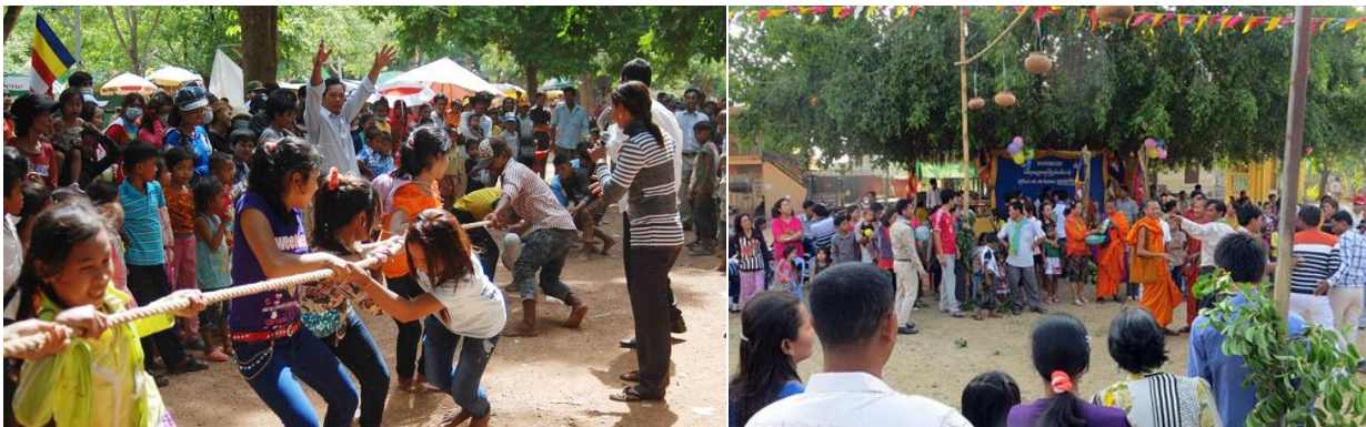
សកម្មភាពល្បែងកម្សាន្តនៅពិធីបុណ្យចូលឆ្នាំខ្មែរ