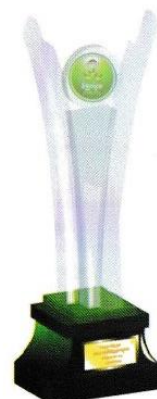
ការទ្រង់សម្រាប់ទីក្រុងស្អាត ដែលទទួលបានក្នុងឈ្មោះឆ្នាំ ៣ ២០