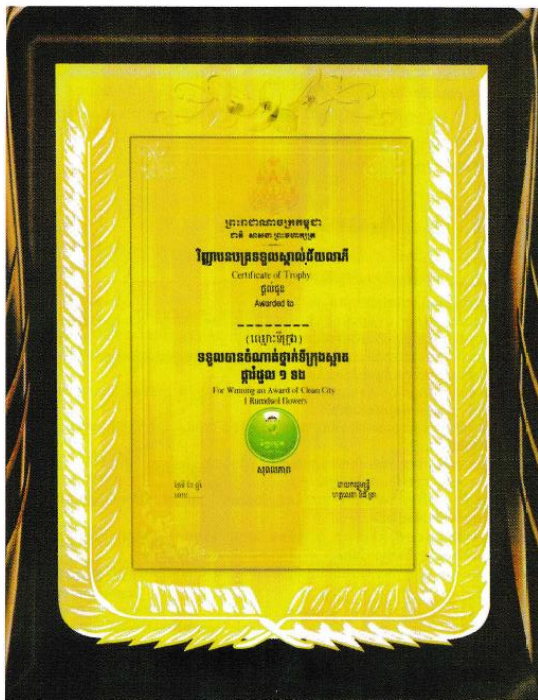
ទិញ្ញាបនបត្រទទួលបានស្នាដៃទី១ ដែលទទួលបានក្នុងឈ្មោះឆ្នាំ ១ ២០