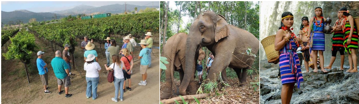
ទិដ្ឋភាពមួយចំនួនដែលទាក់ទងនឹងគោលបំណងស្វែងយល់ ទស្សនា និងសកម្មភាពផ្សេងៗ