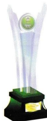
ការទ្រង់សម្រាប់ទីក្រុងស្អាត ដែលទទួលបានក្នុងឈ្មោះឆ្នាំ ២ ២០